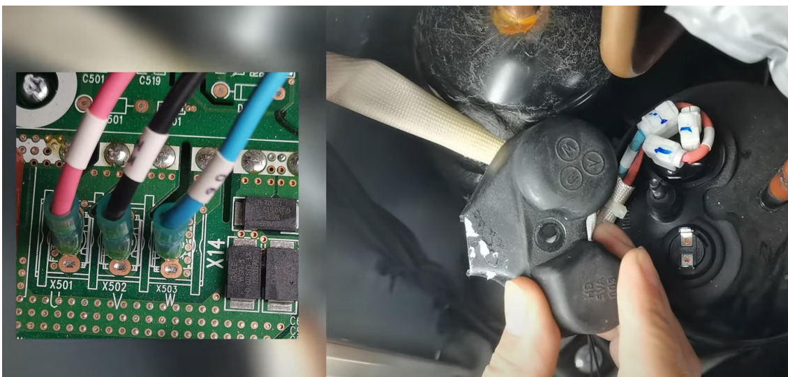
Ispravan spoj kompresora